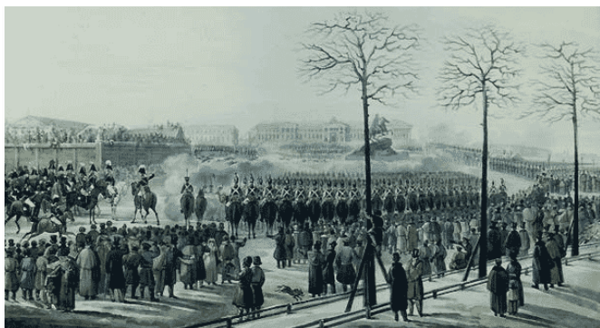
Восстание 14 декабря 1825 г. в Петербурге

Людей, которые хотели дать народу равноправие, называли революционерами. Сначала, еще в XIX веке это были дворяне-декабристы, потом разночинцы-народовольцы, которые даже пытались убить царя.