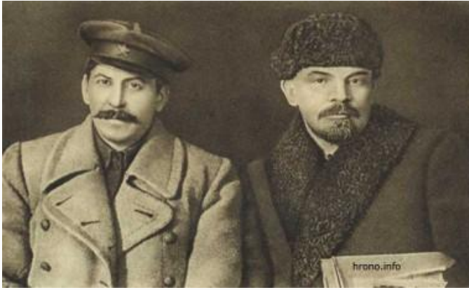
Ленин и Сталин