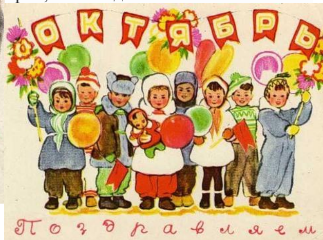
Октябрь. Поздравляем! Художник А. Брей, 1962 год.