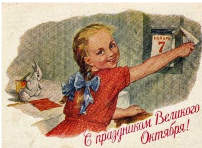
С праздником Великого Октября! Художник С. Адрианов, 1954 год.

И в самом деле, чему удивляться? Сейчас другое время, другие герои. Не вспоминают о Ленине. Может, это и хорошо, что дети ничего не знают? Но ведь замалчивание – та же ложь. А что если рассказать им правдивую сказку про этот день? Мы тут попробовали представить, как могла бы выглядеть такая сказка.