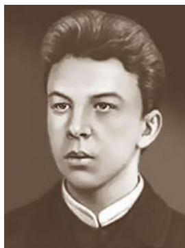
Александр Ульянов, один из организаторов покушения на царя Александра III

Так, на виселице погиб Александр Ульянов, который верил, что, если убить «плохого» царя, жизнь народа станет лучше. «Нет, мы пойдем другим путем, – сказал его младший брат, студент Володя Ульянов.