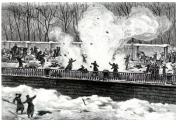
Покушение на царя

совершали преступления ссылали в Сибирь, на каторгу, или в тюрьму, или вешали.