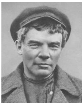
Владимир Ульянов (Ленин) в октябре 1917 года

Светлое будущее после победы революции эта партия называла коммунизмом, а людей, которые борются за него – коммунистами, или большевиками. Многие ее вожди до революции жили за границей, многие отбывали срок в ссылке. Владимира Ульянова, который стал главой этой партии, товарищи называли специальным конспиративным именем – Ленин.