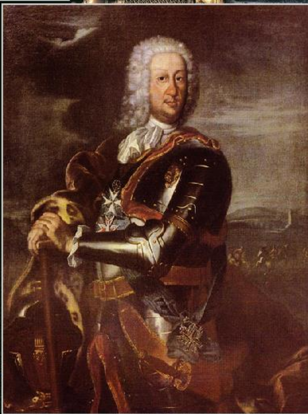
Портрет Б.П. Шереметева