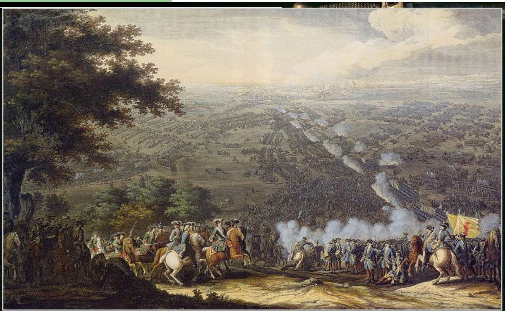
Полтавская баталия 27 июня 1709 г.