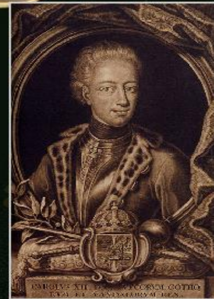
Портрет Карла XII

Россия, Саксония и Дания заключили союз против Швеции