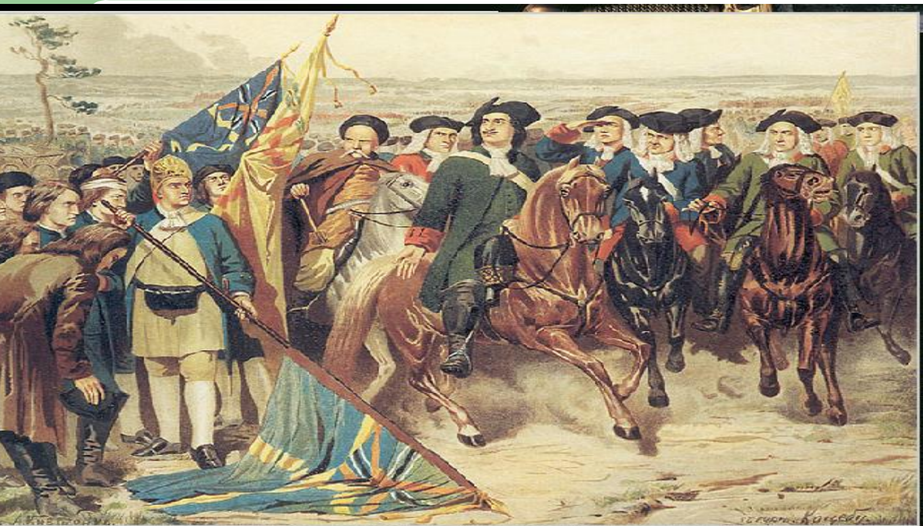
Полтавский бой. Шведы преклоняют знамена перед Петром I. 1709