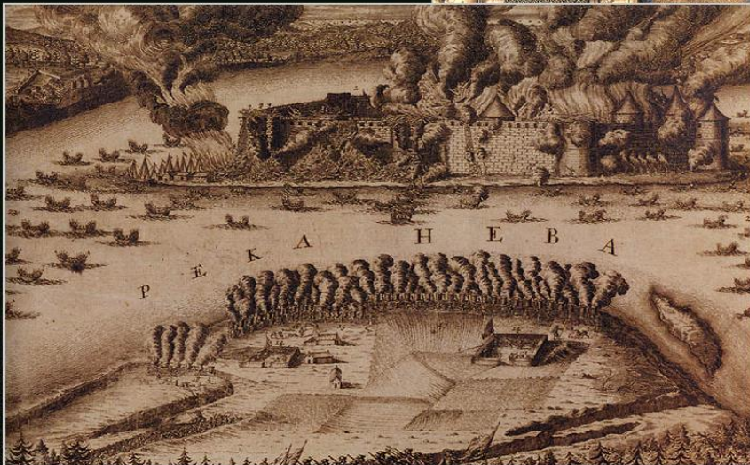
Штурм шведской крепости Нотебург 11 октября 1702 г.