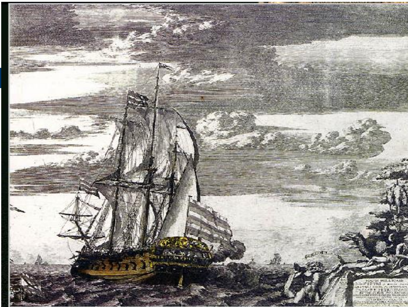
Корабль "Готопредистинация". Вид с кормы