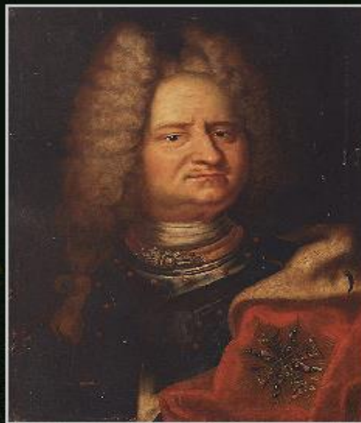
Август II Сильный