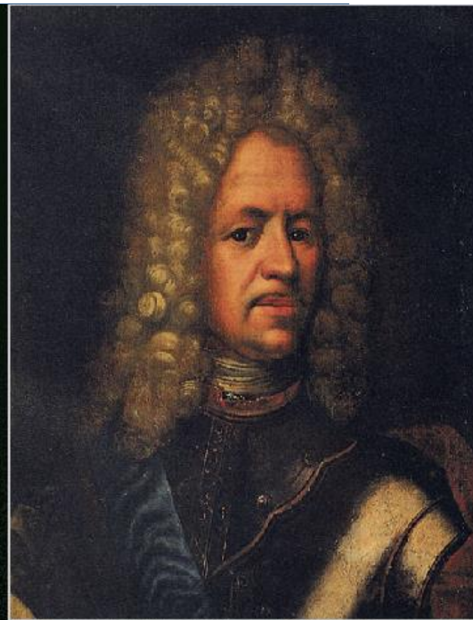
Портрет А.Д. Меншикова