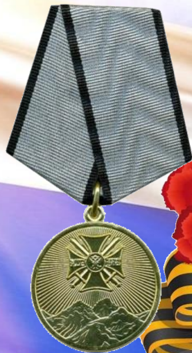
Медаль «За службу на Северном Кавказе»